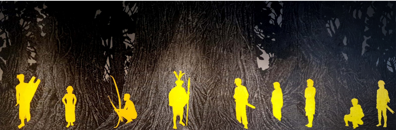
TAHANAN 72 X 144 inches Acrylic on Csnvas 2020