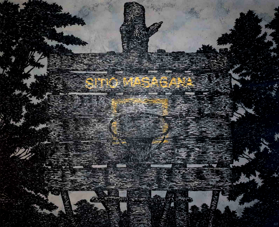
HIMPILAN 48 X 60 inches Acrylic on Canvas 2020