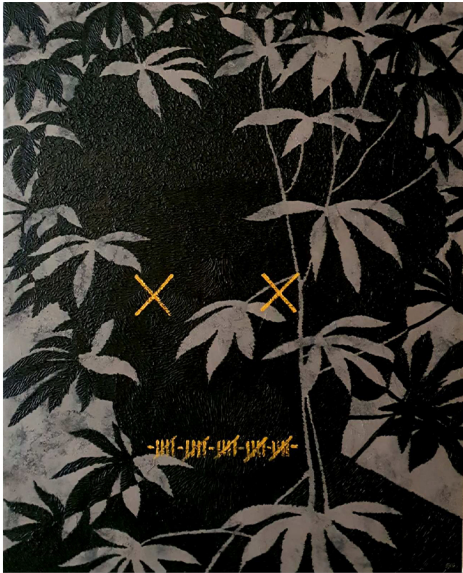
KUTYA 60 X 48 inches Acrylic on Canvas 2020