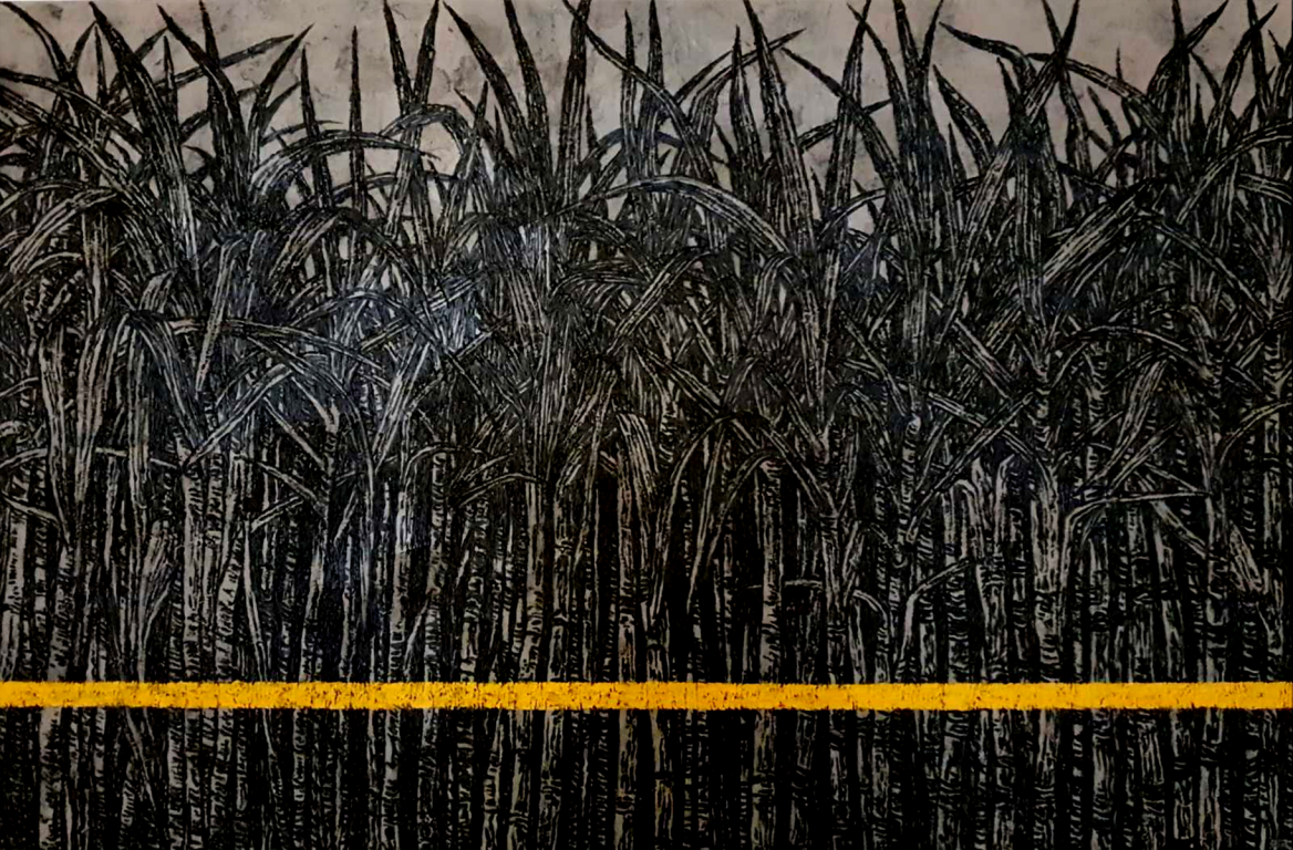
SIGNOS 48 X 72 inches Acrylic on Canvas 2020