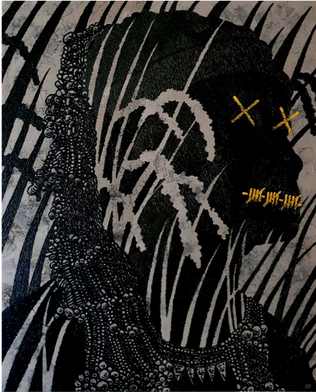
LIKAS 60 x 48 inches Acrylic on Canvas 2020