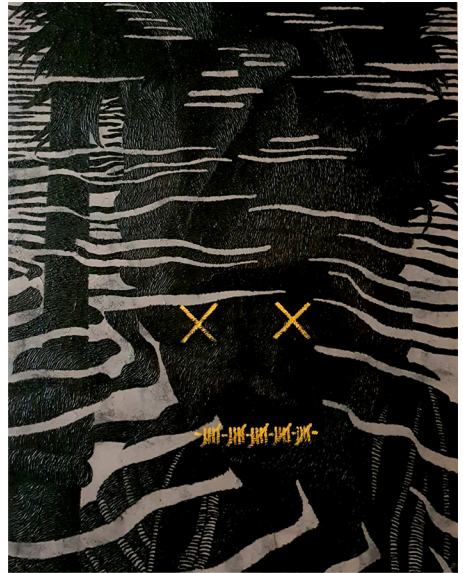
DIWANG 60 X 48 inches Acrylic on Canvas 2020